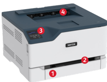
Xerox® C230 kleurenprinter