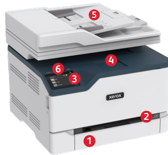
Xerox® C235 multifunctionele kleurenprinter 6 USB-poort aan de voorzijde