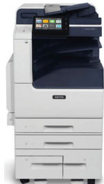
Xerox ® VersaLink ® B7125/B7130/B7135 Multifunctionele printer