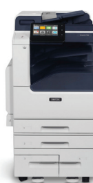
Xerox ® VersaLink ® C7120/C7125/C7130 Multifunctionele kleurenprinter