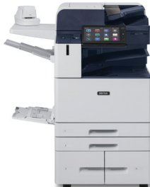
Xerox ® AltaLink ® C8130/C8135/C8145/C8155/C8170 Multifunctionele kleurenprinter