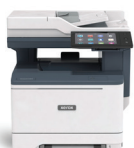
Xerox ® VersaLink ® C415 Multifunctionele kleurenprinter