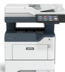
Xerox ® VersaLink ® B415 Multifunctionele printer