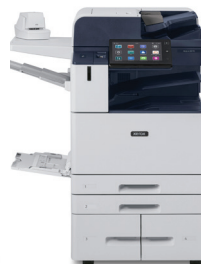
Xerox ® AltaLink ® B8145/B8155/B8170 Multifunctionele printer

*Product niet in alle regio's beschikbaar, neem contact op met uw vertegenwoordiger.