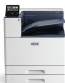
Xerox ® VersaLink ® C8000 Kleurenprinter