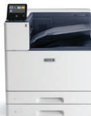
Xerox ® VersaLink ® C9000 Kleurenprinter