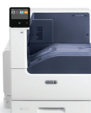
Xerox ® VersaLink ® C7000 Kleurenprinter